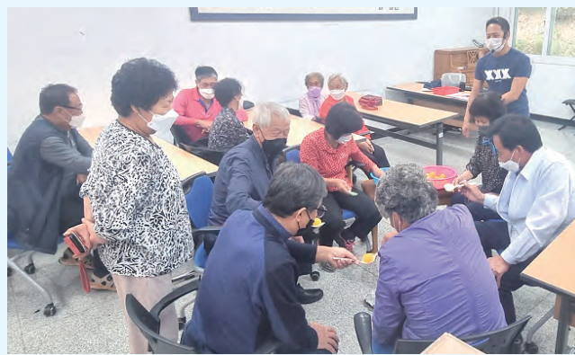
홍노복카 시동을 걸다

치매예방 프로그램에 참여하셨던 어르신 중 한 분은 "오늘 같은 날에는 집안에서만 혼자 외롭게 지내게 되어서 답답했는데 이렇게 먼 곳까지 찾아와 주어서 너무 감사하다"면서 동료어르신과 함께 흥이 나서 콧노래를 부르시면서 프로그램 처음부터 끝까지 재미있게 참여해 주셨다.