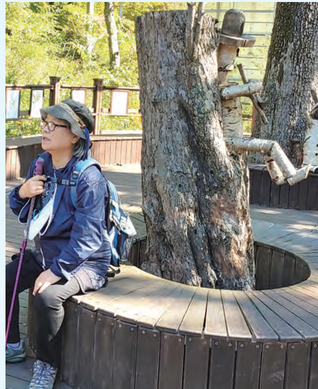
◇오랜만에 누리는 자유

아내는 숨이 막힐 것 같다며 하루가 멀다 하고 외출했다. 퇴직하면 집에서 아내가 차려주는 밥상을 받으며 소파에 편안히 앉아 독서도 하고 가끔 영화감상이나 하면서 지내게 될 것 같았었다. 일만 하느라 만나던 친구도 없고 딱히 어디 찾아 나설 데도 없다. 직장에서 같이 일하던 동료들은 O씨보다 훨씬 일찍 퇴직해서 나름대로 다른 일들을 하고 있어서 만나기도 쉽지 않다. 그렇다고 직장 후배들을 만나보려니 그들에게 일만 독려했지 살갑게 대해준 적도 없어서 그런지 슬슬 괴하는 것 같다. O씨는 대부분 집에 틀어박혀 있게 되고 혼자서 라면이나 끓여먹게 되는 날이 많아졌다.