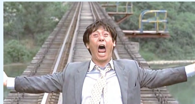
◇영화 '박하사탕'의 마지막 장면. 주인공이 철로 위에서 '나 다시 돌아갈래' 절규하고 있다.

퇴직할 때에 '수고했다'고 한 말은 입에 발린 소리였나? 아내는 갈수록 짜증만 내고 자식들은 언제 아버지 노릇 제대로 해 본 적이 있느냐는 듯이 핀잔주고 따지고 든다. O씨는 즐지에 개밥에 도토리가 된 기분이다. 도대체 내가 뭘 잘못했는데? 가족들을 먹여 살리느라 밤낮없이 죽어라 일한 죄 밖에 없는데. 그는 억울했다. 그리고 분노가 일었다. 그러나 시간이 지날수록 왜 그렇게 살았나 싶은 후회가 스멀스멀 올라왔다. 어디서부터 잘못된 걸까?