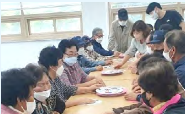
이동복지관 함께해요 우리마을

9월 29일(수) 내촌면 복지회관에서 어르신 40명을 대상으로 치매예방 프로그램을 진행했다.