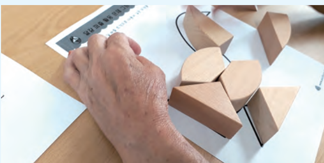
◇어르신께서 밑그림 안에 나무 조각을 맞추는 모습

“이것은 뭘데... 이렇게 생겼대우?” 어르신께서 다양한 모양의 나무 조각을 손으로 만져 보십니다. 촉감은 부드럽지만 나무를 잘라서 왜 이렇