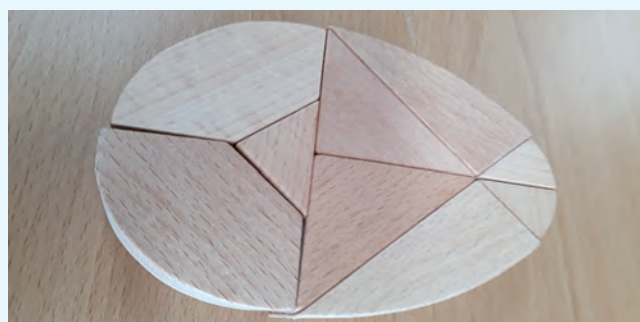
◇나무퍼즐 완성된 모습

“이것은 뭘데... 이렇게 생겼대우?” 어르신께서 다양한 모양의 나무 조각을 손으로 만져 보십니다. 촉감은 부드럽지만 나무를 잘라서 왜 이렇