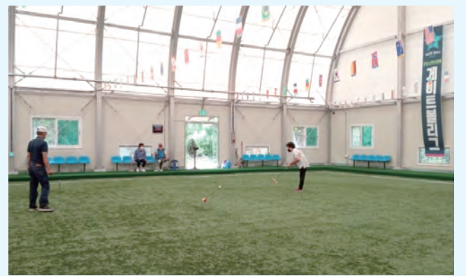
홍천군노인복지관장배 게이트볼 대회

9월 3일부터 매주 토요일 13시부터 16시까지 각 읍면 별로 게이트볼 리그전이 진행되고 있다.